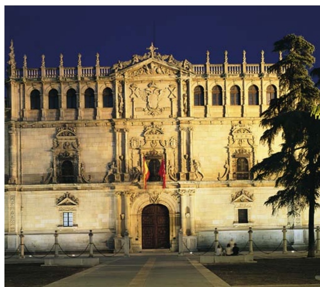
Bureau de Alcalá: Place de San Diego, 28801 Alcalá de Henares (Madrid, Espagne)