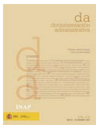
Documentación Administrativa (DA)