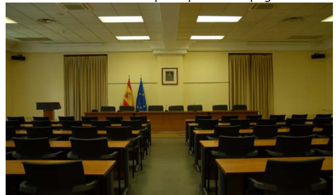
Notre grande salle de conférences

Pendant l'année 2010, l'institut a fourni plus de 52.000 heures de formations, destinées à environ 25.000 agents de toutes les Administrations publiques de l'Espagne.