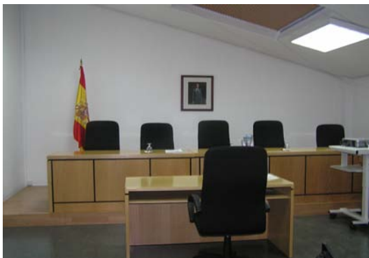
Une de nos salles d'examen

Le recrutement au sein de la fonction publique est l'une des tâches principales de l'INAP. Chaque année, l'Institut organise, d'une manière centralisée, plusieurs concours publics, transparents et équitables, pour différents corps de fonctionnaires de l'Administration d'Etat, qui vont du personnel de secrétariat au corps des Administrateurs. Ceci est fait par le Comité Permanent de Sélection (Comisión permanente de selección), ou par des commissions de sélection spécifiques (pour les corps supérieurs de la fonction publique). En 2010, et suite à l'annonce annuelle des vacances d'emploi dans la fonction publique, l'Institut a mis en oeuvre onze processus de sélection, auxquels plus de 13.000 candidats ont présenté leur candidature, pour un total de 395 postes.