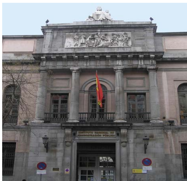
Bureau de Madrid: 106, rue Atocha, 28012 Madrid (Espagne)

L'Institut National de l'Administration Publique (en Espagnol: « Instituto Nacional de Administración Pública – INAP ») est un établissement public de l'Administration nationale de l'Espagne, doté de la personnalité morale et de l'autonomie de gestion, rattaché au Ministère de la Politique Territoriale et de l'Administration publique. Il a une tradition de longue date de plus de soixante-dix ans de travail dans le secteur public, puisque ses origines remontent à 1940