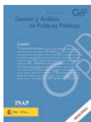
Gestión y Análisis de Políticas Públicas (GAPP)