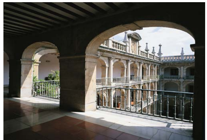
Nos installations à Alcalá de Henares