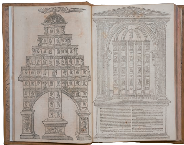
Un de nos plus anciens livres du XVIe siècle Las Siete Partidas , du roi Alfonso X

Il est à noter que l'Institut est doté d'une bibliothèque magnifique, spécialisée dans l'Administration publique, la gouvernance et le Droit public, qui compte plus de 230.000 volumes et environ 1500 publications périodiques. La bibliothèque conserve également une collection de livres anciens, qui comporte plus de 9.000 volumes, publiés entre le XVIème et le XIXème siècles.