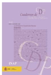
Cuadernos de Derecho Público (CDP)

En outre, l'activité de recherche de l'Institut est effectuée en créant des « groupes d'experts », en octroyant des prix de recherche et de thèses, en décernant des bourses (notamment celle du programme INAP-Fulbright), et via l'organisation de conférences, de rencontres et de congrès.