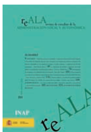
Revista de Estudios de la Administración Local y Autonómica (REALA)

L'INAP favorise la recherche et les études multidisciplinaires sur l'Administration publique. Depuis son établissement, l'Institut a effectué une importante activité d'édition, avec plus de 700 livres parus. Tous ont été numérisés et sont mis à la disposition du public. En outre, l'Institut édite actuellement quatre revues périodiques, ayant une perspective juridique et de management public :